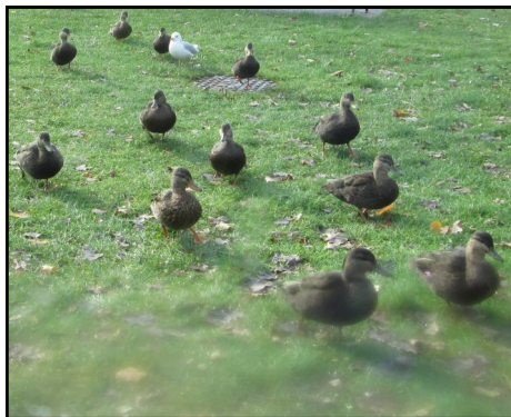
Dans la foule

Les projets Photovoice ont recours à la photographie pour accorder une liberté d'action aux participants et susciter un intérêt envers une question particulière. Dans le cadre de Photovoice, les participants ont l'occasion d'en apprendre davantage au sujet de la photographie, de s'exprimer de façon créative et de créer des liens solides avec leurs pairs. Les projets Photovoice sont populaires dans le domaine de la santé mentale, car ils permettent de voir autre chose que la maladie. Par la photographie, les participants ont l'occasion de montrer leur perception du monde. Les images peuvent être très percutantes et émouvantes. Les participants des sites de New Liskeard et de Kirkland Lake ont pu prendre part aux projets PhotoVoice, car on leur a fourni des appareils photo et on leur a montré comment s'en servir. Les participants ont également eu l'occasion d'exposer leurs œuvres dans la collectivité.